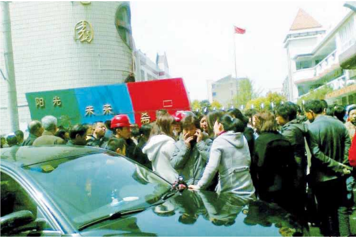
Le 29 avril au matin des dizaines d'enfants ont été attaqués dans une maternelle de la province de Jiangsu à l'Est de la Chine.

résume quelques implications sociales de « l'acte de vengeance » dont les maladies mentales, les différences de revenus et le manque de contrôle. Cependant, Xu Zhiyong remarque que le problème ne pouvait pas être résolu par l'étouffement des informations ou le renforcement du contrôle : « Si cette série de drames ne conduit pas à une meilleure gestion de la société, nous perdons des opportunités de transformation. Ces tragédies sociales doivent apporter une plus profonde signification, si nous ne voulons pas voir ces choses se développer dans la direction