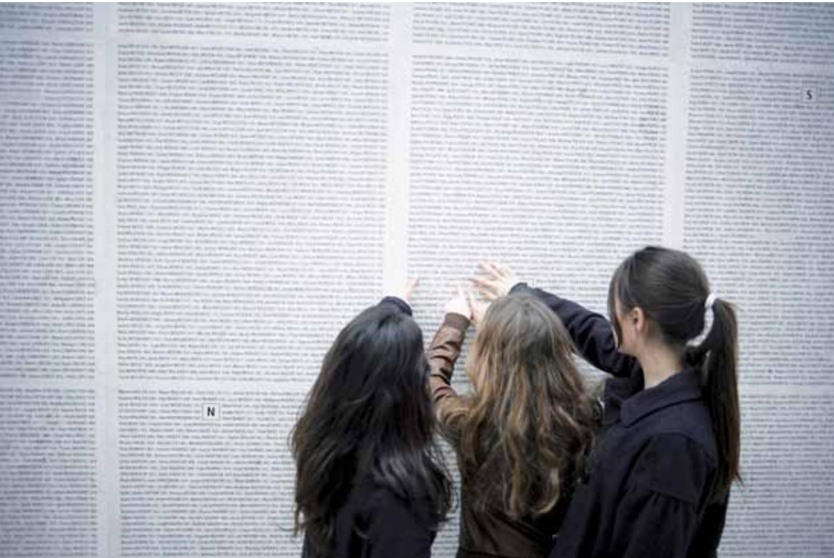
FRANCE, Paris : Le 11 avril 2010, trois adolescentes lisent le Mur des noms qui porte, gravés dans la pierre, les noms, prénoms et dates de naissance des 76.000 juifs déportés de France entre 1942 et 1944. Le Mémorial de la Shoah, près de soixante ans après la fin de la seconde guerre mondiale, est né d'une volonté commune du Mémorial du martyr juif inconnu et du Centre de documentation juive contemporaine (CDJC), déjà installés sur le site, de s'ouvrir à un plus large public sur 5.000 m².