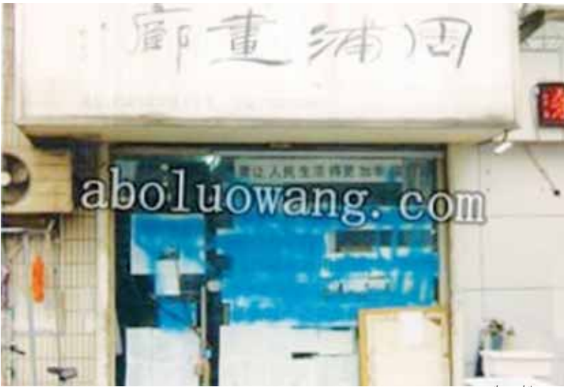
Après la diffusion d'une photo de l'enseigne sur internet, la boutique a été vandalisée avec une bombe aérosol.

peinture la devanture de la boutique. Il a filmé les vandales et a mis la vidéo en ligne. La Grande Époque a tenté en vain de joindre Mme Cao avant le bouclage de cet article. Mme Cao avait auparavant prévenu le journal que son téléphone était sur écoute. En Chine, forcer les citoyens à abandonner leur maison et leurs terres au profit du développement urbain ou d'installations de luxe est monnaie courante, et engendre colères et manifestations. Les relocalisations forcées sont devenues « un cauchemar » notamment en raison des compensations insuffisantes généralement offertes aux propriétaires. À Shanghai, entre 70 et 80 % des plaintes déposées en 2009 auprès des hauts fonctionnaires pour des injustices