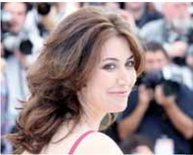
La réalisatrice italienne Sabina Guzzanti lors de la présentation de son film Draquila - L'Italie qui tremble au 63 e Festival de Cannes, le 13 mai 2010.

Pour départager les avis, il faut faire appel à des historiens spécialisés dans la guerre d'Algérie. En effet, un film est un moment dans une histoire qui ne dit pas tout. Nous n'en avons jamais terminé avec l'histoire des faits obscurs. Là les exigences patriotiques rendent le film irrespectueux sans appel, mais en revanche l'artiste n'est pas davantage respecté pour ses obligations artistiques.