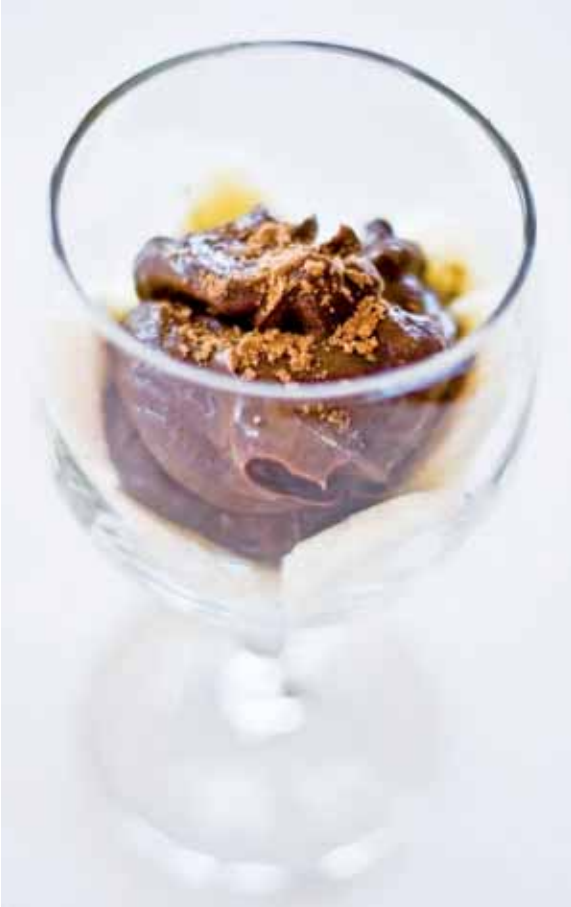
Grace Wu, La Grande Epoque

Pâtes au guacamole : idéal pour satisfaire une grande envie d’avocat sans chips.