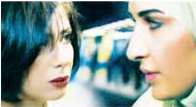
La Femme du Caire (2009) de Yousry Nasrallah.

Le ministre de la Culture Sando Bondi n'accepte pas davantage la projection spéciale de Draquila, l'Italie qui tremble (2010) de la cinéaste anti-Berlusconi, Sabina Guzzanti qui a enquêté sur l'opacité et les arrangements entre l'État et les entreprises ayant participé à la reconstruction de l'Aquila détruit après le séisme en avril 2009. L'homme politique n'a pas vu le film, seulement un extrait diffusé à la télévision. Se sentant investi politiquement, il crie à l'insulte contre le peuple italien et la vérité. Il est difficile de parler de respect vis-à-vis des auteurs lorsque les acteurs des conflits ne voient pas les films avant de porter un jugement digne d'être écouté. Les accents du film politique font ressurgir de ces saines polémiques sous les yeux du président du jury du festival, Tim Burton, habitué à tous les surréalismes puisque ses films en sont