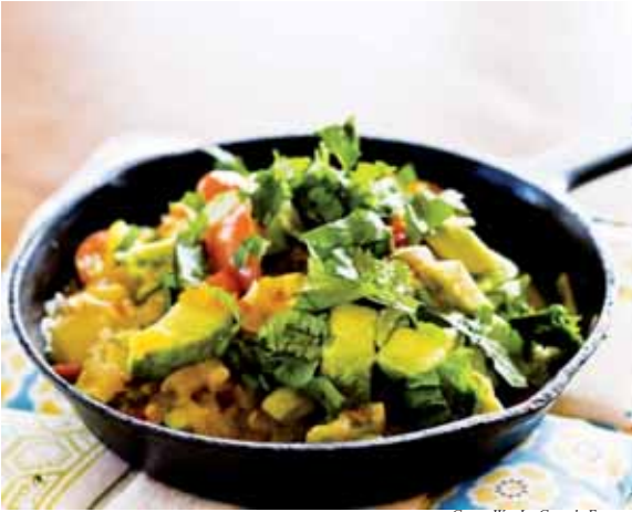
Grace Wu, La Grande Epoque

Pâtes au guacamole : idéal pour satisfaire une grande envie d’avocat sans chips.