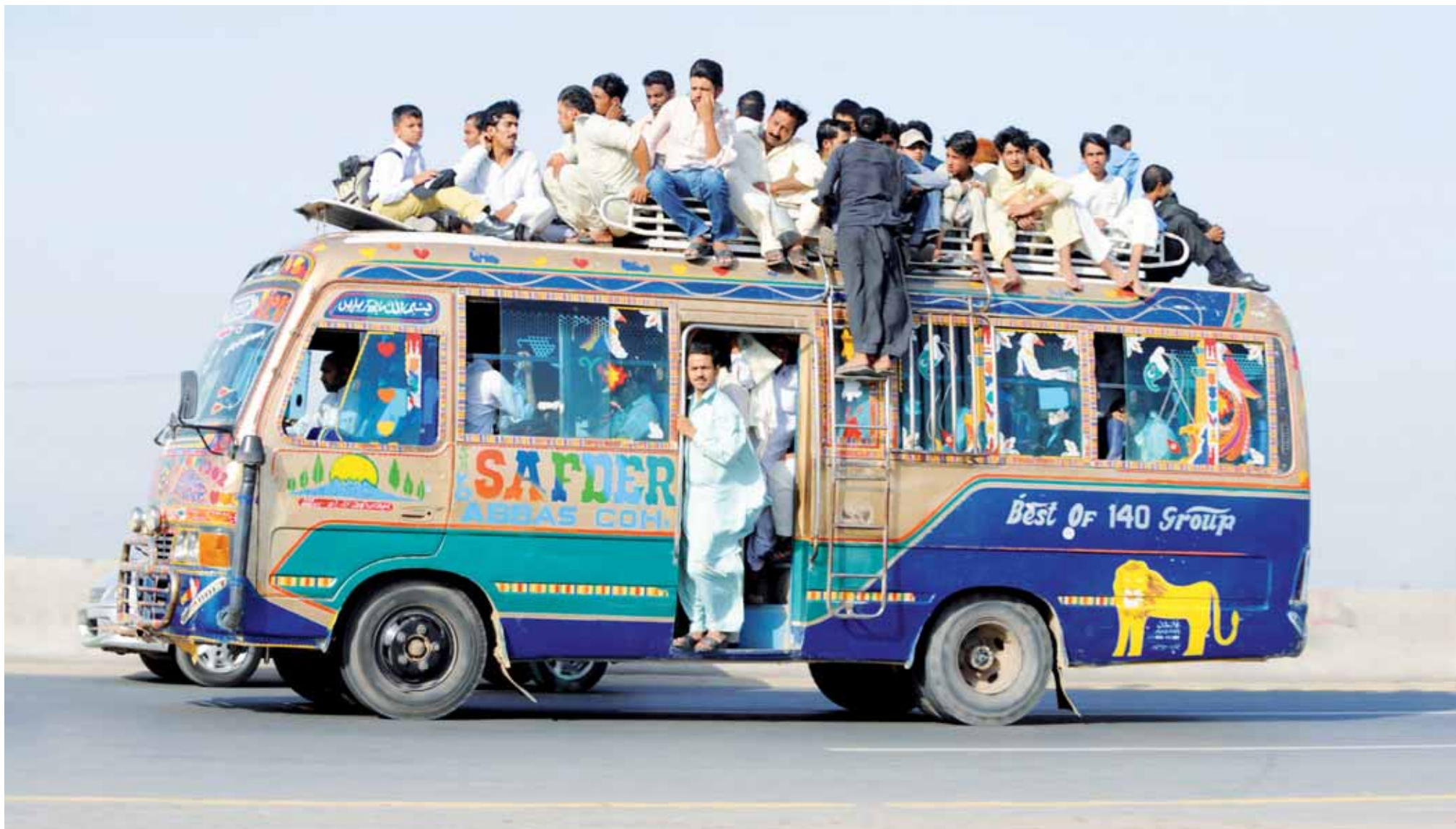
QUELQUE PART, Pakistan. De la problématique d'assurer des transports réguliers à une population de 170 millions de personnes.