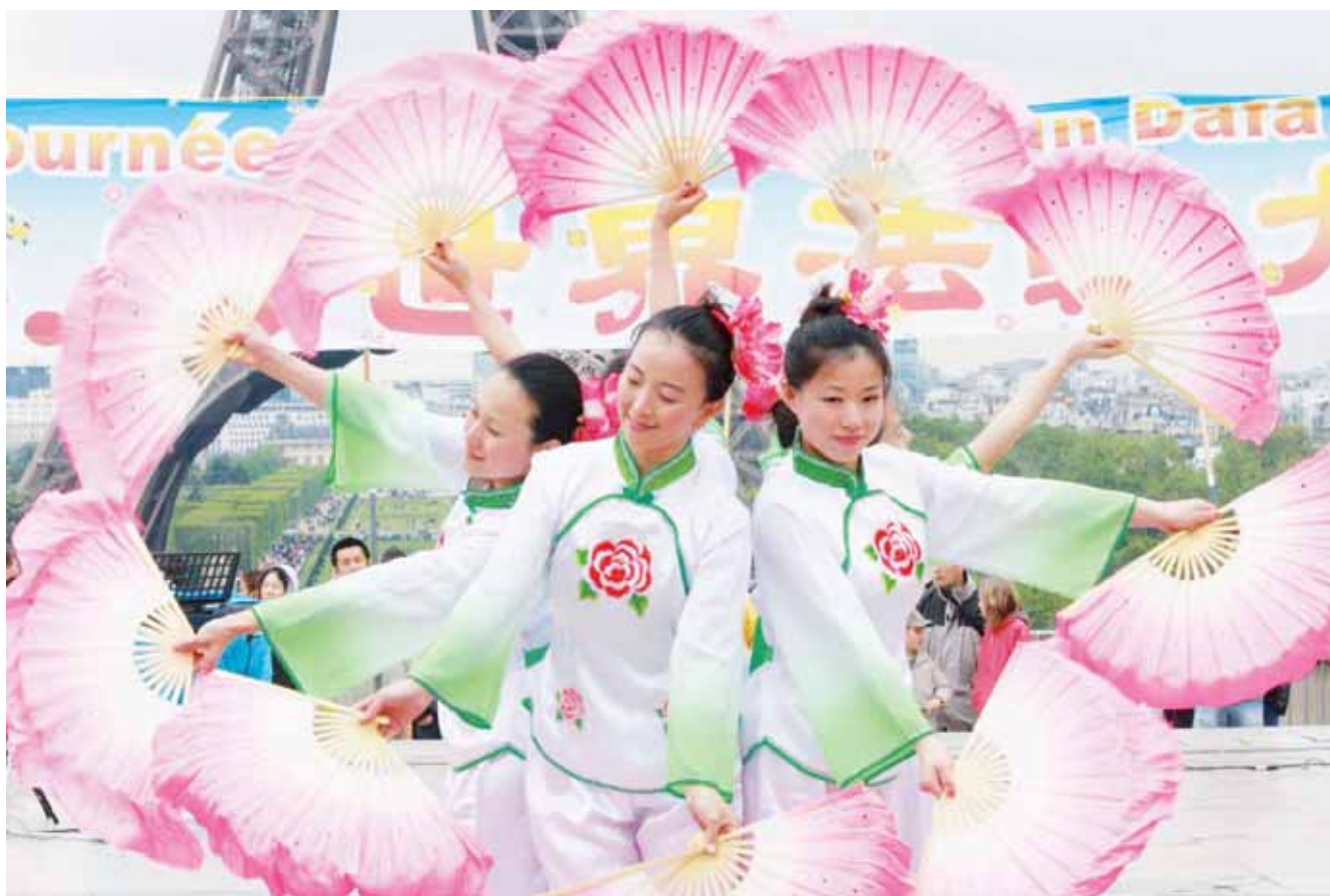
PARIS, France – Le 13 mai, sur le parvis des droits de l'homme du Trocadéro, les membres du mouvement bouddhiste chinois Falun Gong présentent des danses traditionnelles pour célébrer la Journée Mondiale du Falun Dafa. Loin des rassemblements habituels du mouvement focalisés sur la dénonciation de la répression brutale de leurs membres par le régime chinois, le 13 mai a égrené danses, interprétations de flûte chinoise, calligraphie... et cours de méditation pour les Parisiens stressés. (Photo ci-contre)