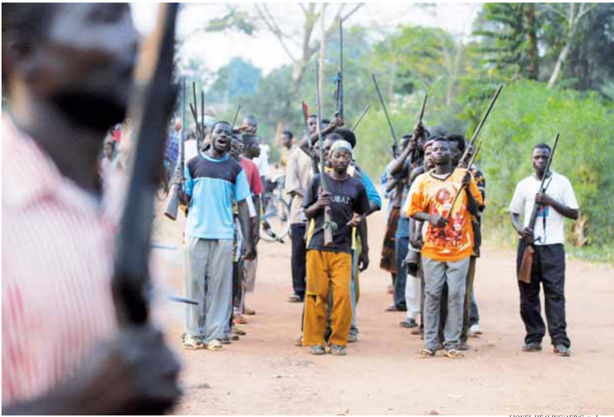
La résistance des villages s'organise, ici à Bangadi, Nord-Est du Congo.

Il a également dit aux journalistes que les Nations Unies enquêtaient actuellement sur des informations faisant état du massacre, en février 2010, d'une centaine de personnes dans le village de Kpanga. Si ces allégations s'avéraient fondées, le nombre de victimes de la LRA s'élèverait à plus de 500 pour cette année seu-